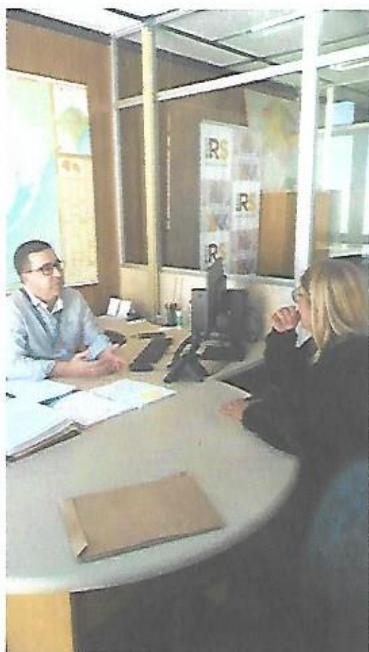
Gabinete do vice-governador

OBSERVAÇÕES: Seguem fotos em anexo das visitas realizadas.