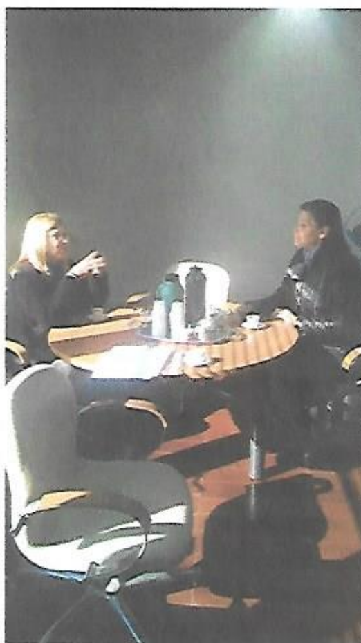
Superintendência de Patrimônio da União