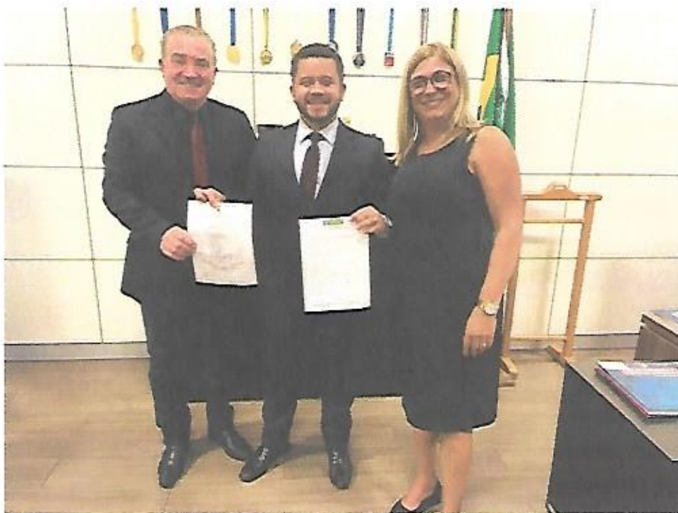
Reunião TC CÂMARA.