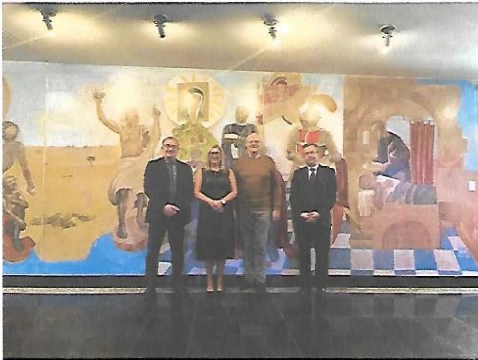
Secretaria de Patrimônio da União.