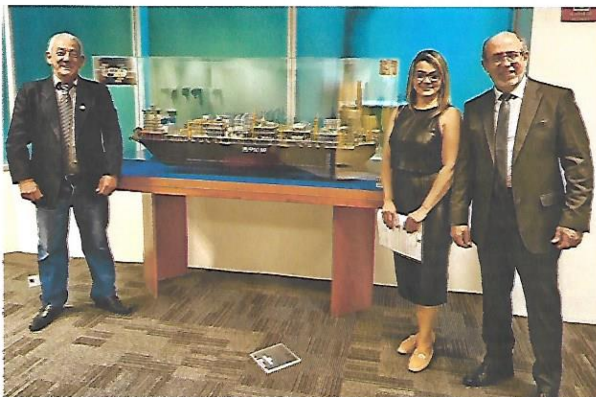
Sede da Petrobras