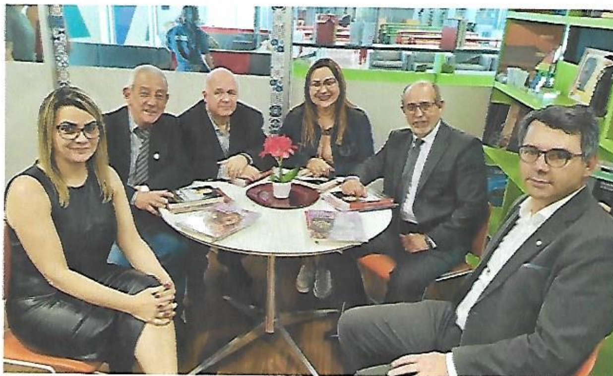
Secretaria do Estado da Cultura e Economia Criativa do RJ