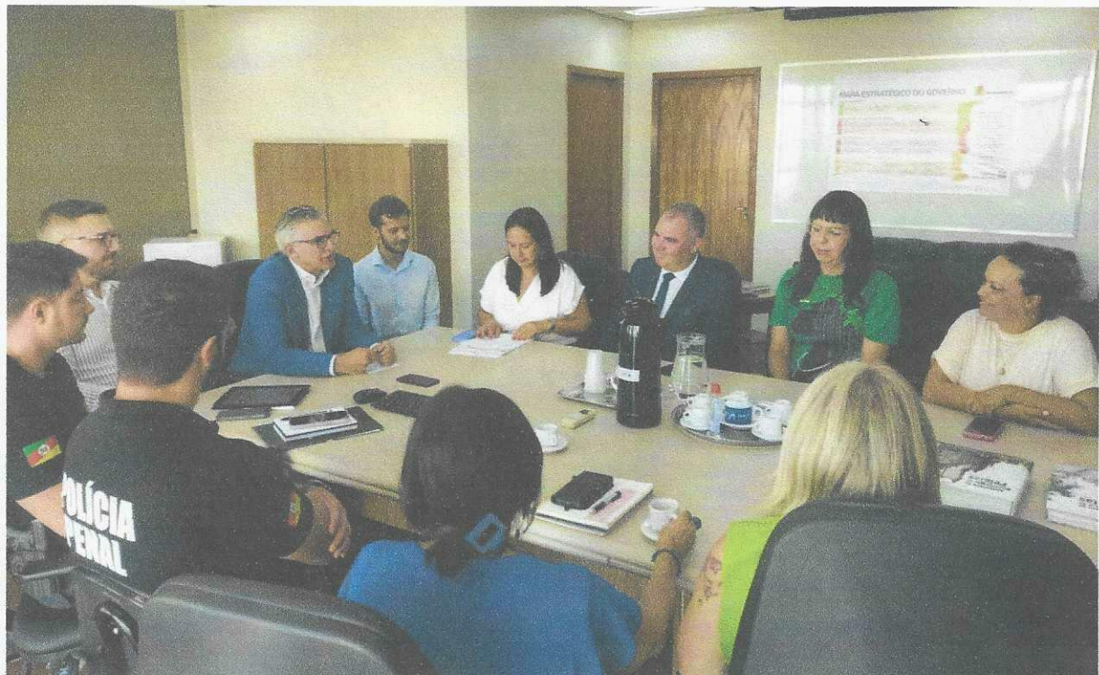
SECRETARIA DE JUSTIÇA E SISTEMA PENAL E SOCIOEDUCATIVO