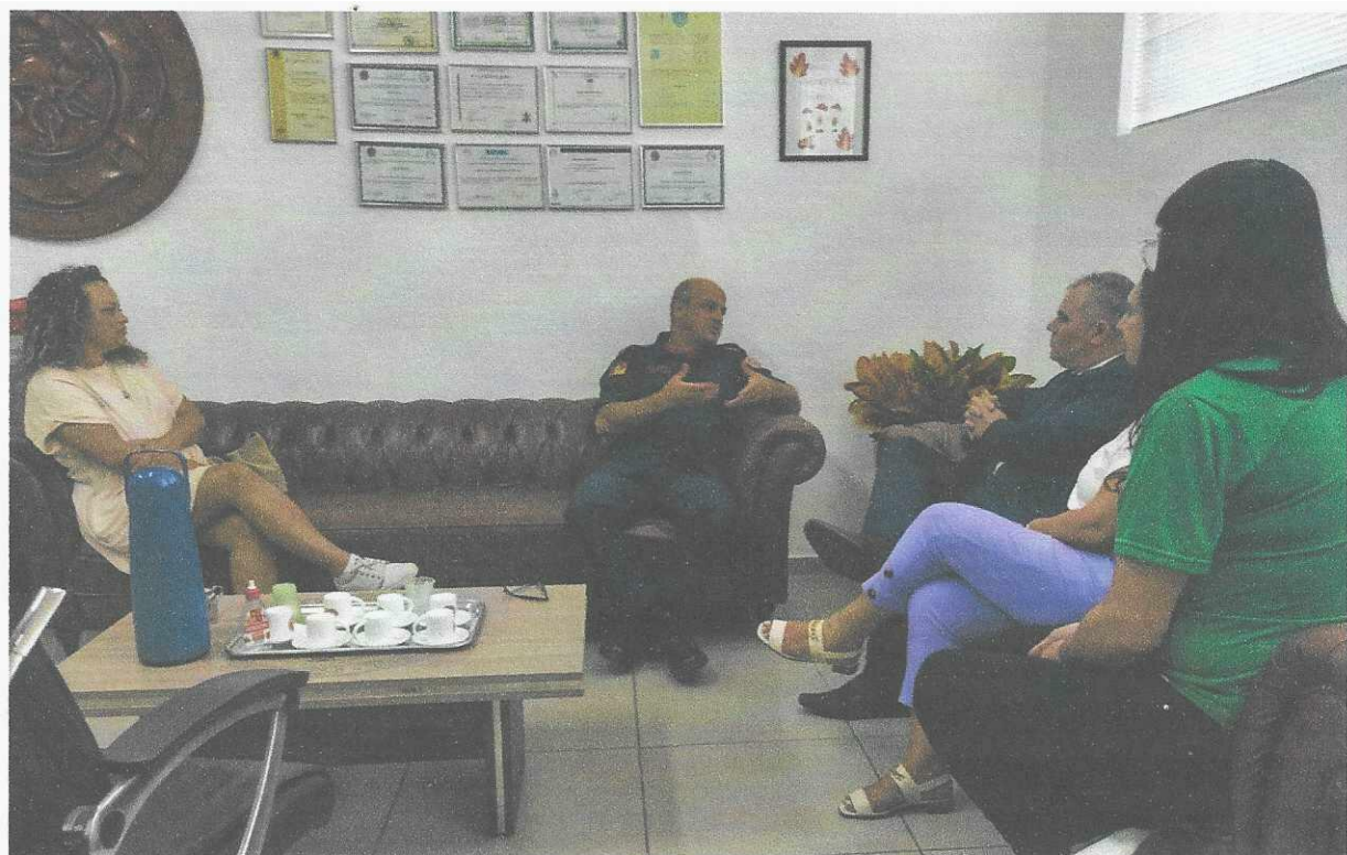
SECRETARIA DA SEGURANÇA PÚBLICA – CORPO DE BOMBEIROS MILITAR