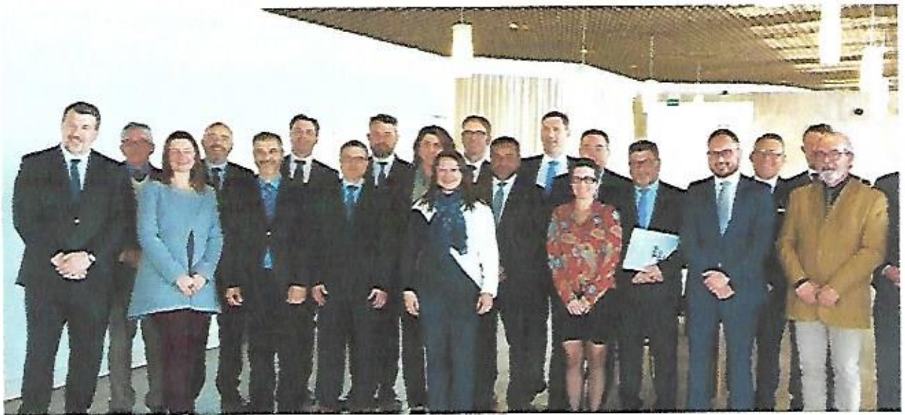
Reunião no Palácio da Justiça