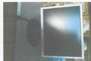
monitor - 1864