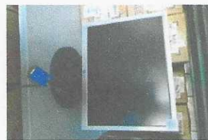
monitor - 1879