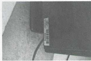
tv - 2219 com placa