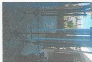
pedestal para iluminação 02