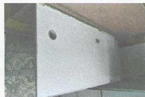
armário de madeira - 1414