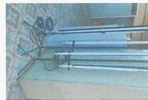
pedestal para iluminação 01