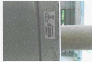
armário de ferro - 149 com placa - JÁ BAIXADA