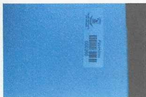
armário de madeira - 266 com placa