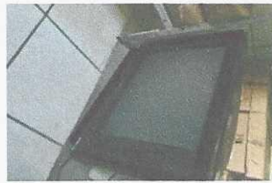
tv - 2219