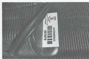
monitor - 1879 com placa