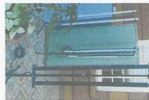
pedestal para iluminação 03