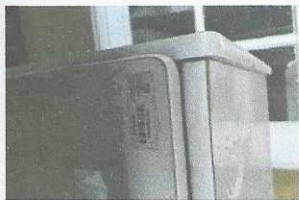
armário de madeira - 902 com placa