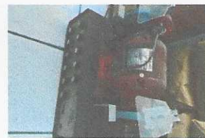
motoserra - 3023