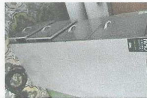
armário de ferro - 1402