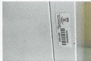
armário de ferro - 1402 com placa