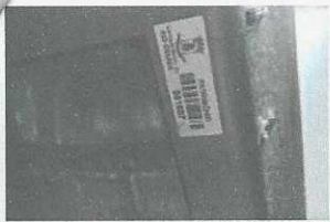
1587 com placa - JÁ BAIXADA