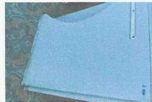
armário de madeira - 266