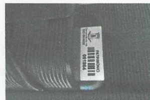
monitor - 1864 com placa