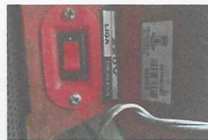
motoserra - 3023 com placa