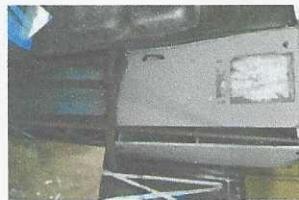
armário de madeira - 902