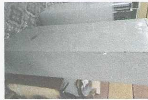
armário de ferro - 149 - JÁ BAIXADA